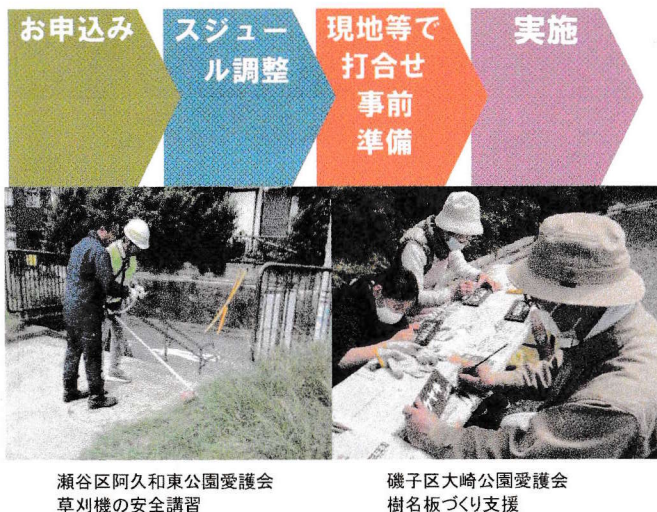
瀬谷区阿久和東公園愛護会 草刈機の安全講習

※現地の状況判断して、希望通りに実施できないことがありますので、ご了承ください。