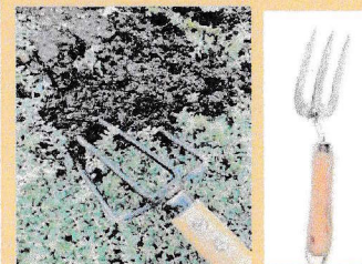
小さな熊手(ガーデンフォーク)

小さな熊手(ガーデンフォーク)やねじり鎌で、株の間を軽く耕すことで、雑草の発生が抑えられます。さらに空気の通りがよくなり、花の根の生長も促進されます。