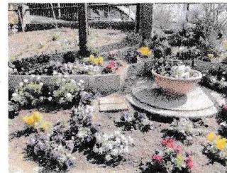
港北区錦が丘公園愛護会の花壇