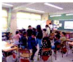
4年生が考えた遊びを試してみました。6年生が思い出を振り返られるような工夫を考えてくれています。会に向けて、各学年の役割の練習をしました。5年生が、下級生の言葉の練習を見守ってくれています

2月3日（火）のたてわり活動では、6年生へのメッセージを書き、17日（火）では、会当日のあそびを考えたり、プログラムのかざり作りをしたりしました。「お別れ会」まで、あと4日。当日の会では、1年生から5年生まで、全学年に役割があります。これまで準備してきたことに自信をもって、心を込めて6年生に感謝の気持ちを伝えます。