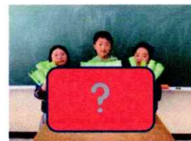
5年生がデザインした6年生へのプレゼント! 6年生は、もらうの楽しみにしていてください。